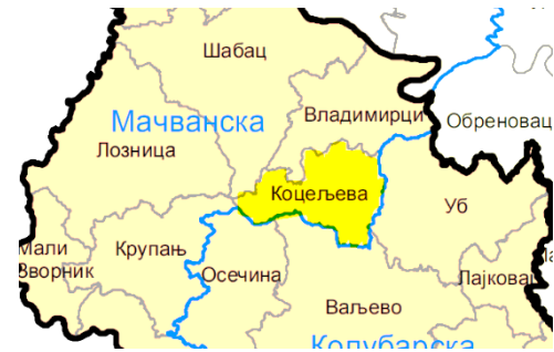
Слика бр.1 : општина Коцељева

Општина Коцељева обухвата површину од 257 км 2 на којој према подацима из 2016. године 8 живи 12.185 становника у 17 насељених места и то: Баталаге, Брдарица, Бресница, Галовић, Голочело, Градојевић, Доње Црниљево, Драгиње, Дружетић, Зукве, Каменица, Коцељева, Љутице, Мали Бошњак, Свилеува, Суботица и Ћуковине. Граничне општине су Шабац и Владимирци на северу, општина УБ на истоку, општине Ваљево и Осечина на југу и општина Крупањ на западу.